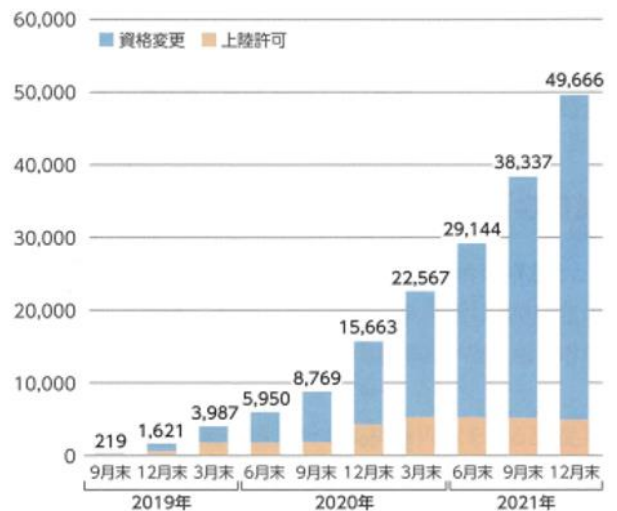
グラフ1 特定技能外国人の在留者数の推移（単位:人）

外国人の在留者総数は、2020年末で288万7千人でしたが、コロナ禍による新規入国の抑制により、2021年6月末には282万3千人と、5万4千人減少しています。そんな中であっても在留資格「特定技能」の在留者数は、2020年末の15,663人から、2021年6月末には29,144人と86%増加しており、さらに2021年12月末には49,666人まで増加しています。特定技能での新規入国は少ないですが技能実習等から特定技能1号へ在留資格を変更した在留者が増えています。