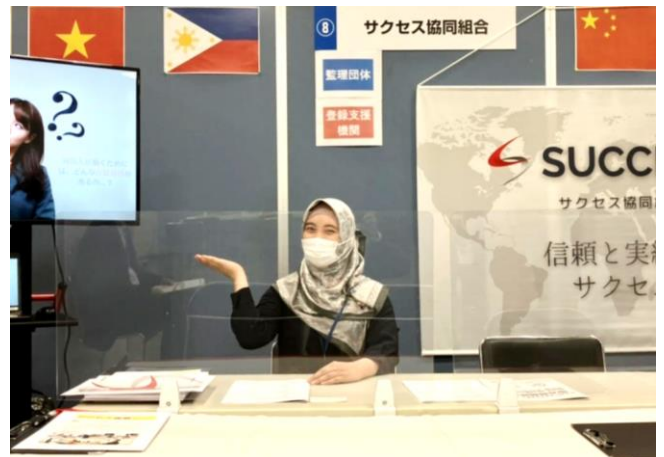
ブースでお出迎え