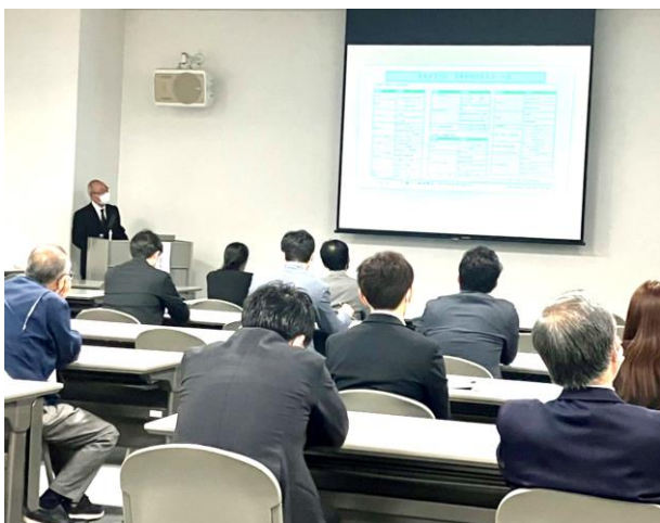
石松理事長が素形材・産業機械・電気電子情報関連製造業のセミナーを担当