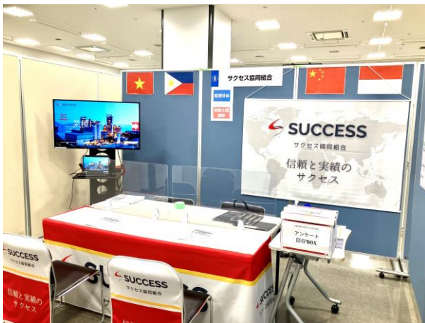
サクセスのブースはテーマカラーの赤・シルバーを基調に